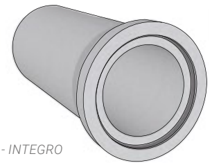
Kruhová trouba - INTEGRO

Trouby jsou standardně vyráběny jako vibrolisované se stupněm vlivu prostředí XF4, na přání zákazníka lze vyrobit se stupněm vlivu prostředí XA3. Délka a tloušťka stěny prvků se mezi výrobními závody z důvodu použití odlišné formovací techniky mírně liší - věnujte prosím pozornost označení výrobku.