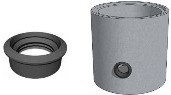
Ukázka prvku - těsnící manžeta

DN 56, 92, 112, 152, 162, 186, 202, 250, 300 mm.